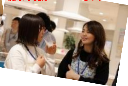
森永牛乳は A or B どちら?