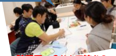
腕豆...?なんて読むの...