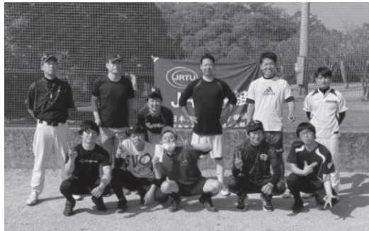
仲間づくりを基点に活動を行う山口第二支部

私たちが、広島地方本部山口第二支部は、山口県の中... 諸課題を解決へ導くために