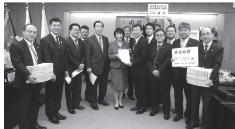
高市総務大臣への要請行動