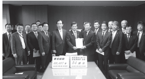
石井国土交通大臣への要請行動

ともに、建設財源を確保し、2022年末の敦賀開業以降すみやかに敦賀・大阪間の工事に着工し、早期の建設・開業が実現するよう強く求めていく。今後の早期着工に向けた財源確保、並行在来線問題の解決に向け、更なる協力をお願いする。