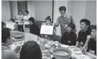
会話のキッカゲが大事!