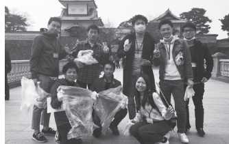
金沢の街はとでも綺麗です!