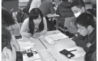
桃太郎かあ〜どこを省略する?