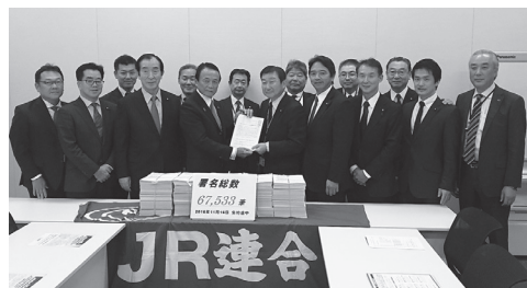
麻生財務大臣への要請行動