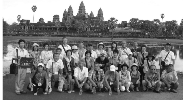
協議会設立を記念して行なわれたアンコールワットの旅

二大プロジェクトの促進に向けた社員の前向きな考動を期待する」との説明があった。中央本部はJR西日本として、グループの働く仲間の労苦に對してもしつかり応えるべき旨を求め了解した。私たちの運動は全組合員の不断の努力により前進している。明日からのJR西労組運動に引き続き総団結を要請する。